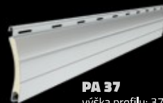
PA 37 výška profilu: 37 mm tloušťka: 8,5 mm