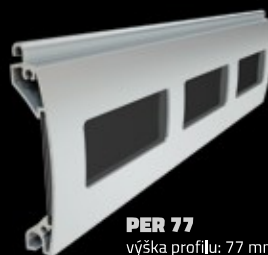
PER 77 výška profilu: 77 mm tloušťka: 18,5 mm