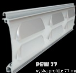
PEW 77 výška profilu: 77 mm tloušťka: 14,5 mm