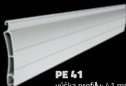
PE 41 výška profilu: 41 mm tloušťka: 8,5 mm