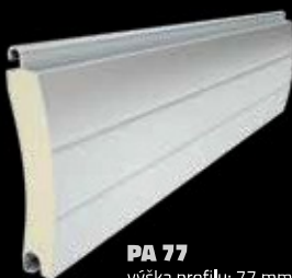
PA 77 výška profilu: 77 mm tloušťka: 18,5 mm