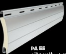
PA 55 výška profilu: 55 mm tloušťka: 14 mm