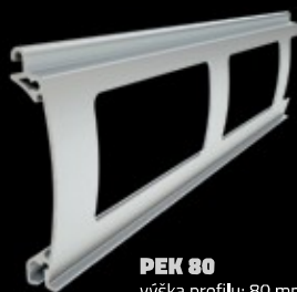
PEK 80 výška profilu: 80 mm tloušťka: 18,5 mm