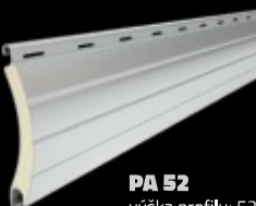
PA 52 výška profilu: 52 mm tloušťka: 13 mm