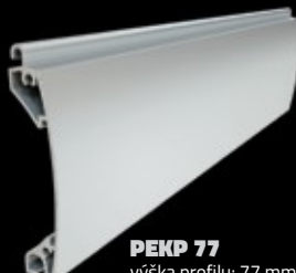
PEKP 77 výška profilu: 77 mm tloušťka: 18,5 mm