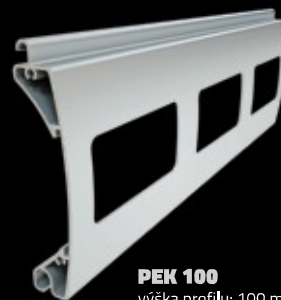
PEK 100 výška profilu: 100 mm tloušťka: 25 mm