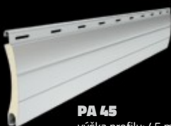
PA 45 výška profilu: 45 mm tloušťka: 9 mm