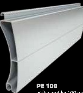
PE 100 výška profilu: 100 mm tloušťka: 25 mm