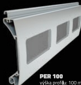
PER 100 výška profilu: 100 mm tloušťka: 25 mm