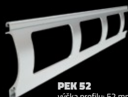
PEK 52 výška profilu: 52 mm tloušťka: 13 mm