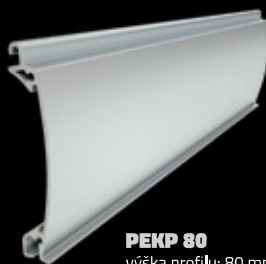
PEKP 80 výška profilu: 80 mm tloušťka: 18,5 mm