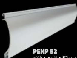
PEKP 52 výška profilu: 52 mm tloušťka: 13 mm