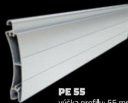
PE 55 výška profilu: 55 mm tloušťka: 14 mm