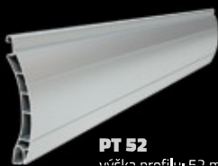
PT 52 výška profilu: 52 mm tloušťka: 14 mm