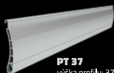
PT 37 výška profilu: 37 mm tloušťka: 8 mm