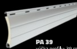
PA 39 výška profilu: 39 mm tloušťka: 9 mm