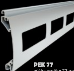
PEK 77 výška profilu: 77 mm tloušťka: 18,5 mm